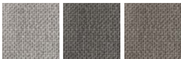
Light grey (AITL)